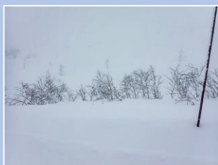
Bコース脇 この日はまだブッシュが目立っていました。