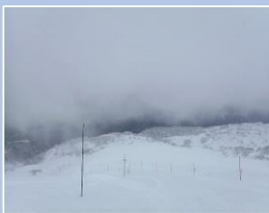
スキーコース 少しだけ視界が開けた瞬間。姿見駅周辺より。