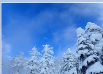
一瞬の晴れ間 登っている途中に見れた本当に一瞬の晴れ間です。