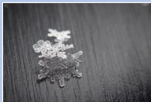
旭岳に降る雪の結晶 肉眼でも確認できる、形の整った大粒の結晶が降っていました。

12/25(金)に、旭岳ロープウェイ再開&スキーコースがオープンしました。例年はロープウェイ再開後に積雪を観測し、スキーコースオープンとなる事が多いですが、今年度は同じ日にロープウェイ再開、スキーコースオープンとなりました。温泉街でも12月初旬~中旬はまとまった雪が降っていたので、山の積雪にも期待していましたが、コースオープン前の12/23(水)時点ではコース脇もブッシュが目立ち思った程の積雪ではありませんでした。シーズンは始まったばかりですが、今年はどんな冬になるのでしょうか。