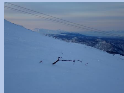
↑Bコース脇のブッシュ (1/26時点)