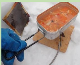
2/6 開催 雪上キャンプ&クッキング