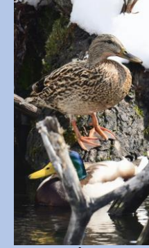
นกเป็ดน้ำมะกาโมะ