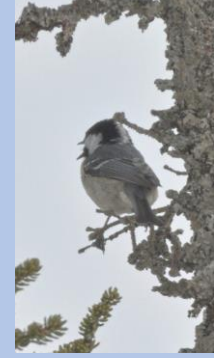
นกฮิการะ