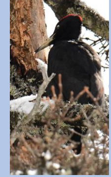
นกหัวขวานคุมะเกะระ