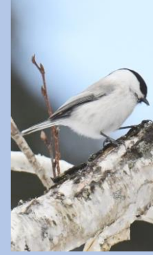
นกโคะการะ