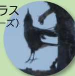
ホシガラス (すこいポーズ)