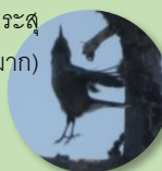
นกโฮชิการะสุ (ลีลาโดนใจมาก)

(มักจะย้ายถิ่นอาศัยมาเมื่อเข้าฤดูใบไม้ผลิ)