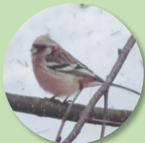
นกเบนินาชิโคะ