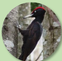
นกหัวขวานคุมะเกะระ