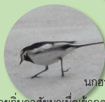
นกฮาคูเซะเคิเร

(มักจะย้ายถิ่นอาศัยมาเมื่อเข้าฤดูใบไม้ผลิ)