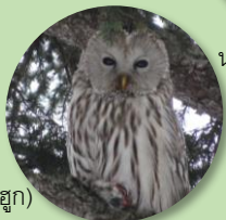
ฟุคุโร (นกฮูก)