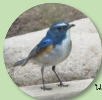
นกจูริปทาคิ