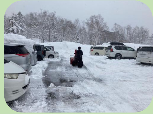
↑ สภาพลานจอดรถหน้า Visitor center (1 พ.ค. 2564)