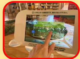
นิทรรศการดิจิทัล (AR)