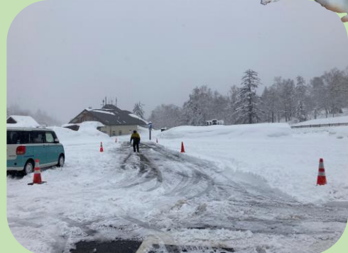
↑ 5/1ビジターセンター前公営駐車場の状況