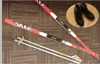
クロスカントリー