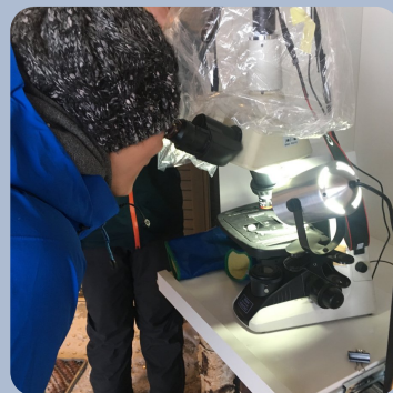
雪の結晶観察会 Snow crystal Observation