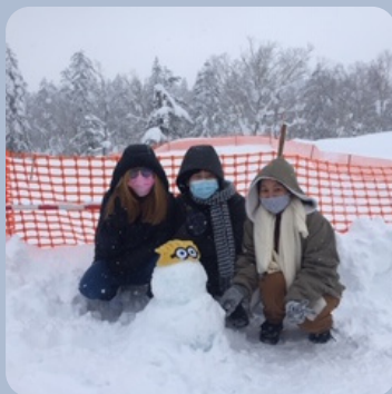
雪遊び Playing with snow