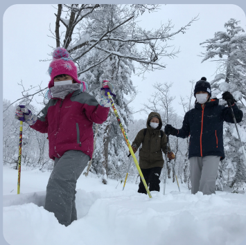
スノーシュー体験 Snow shoe Hiking