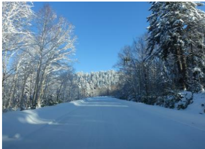
11/16 旭岳温泉街前の道路